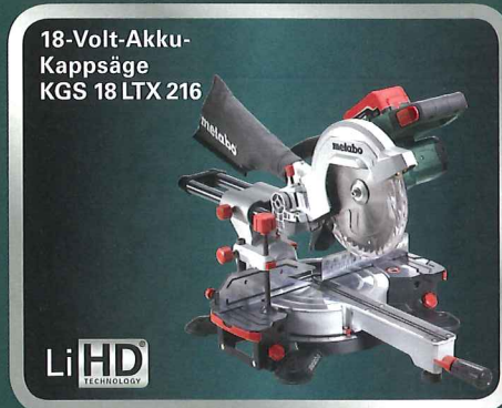
18-Volt-Akku-Kappsäge KGS 18 LTX 216