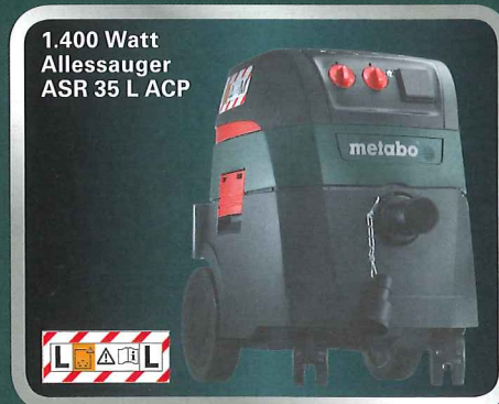
1.400 Watt Allesauger ASR 35 L ACP