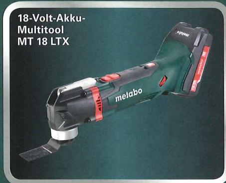
18-Volt-Akku-Multitool MT 18 LTX