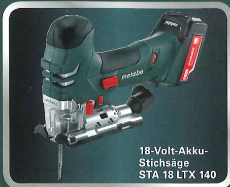
18-Volt-Akku-Stichsäge STA 18 LTX 140