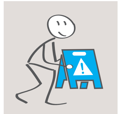
2. Trocknen lassen