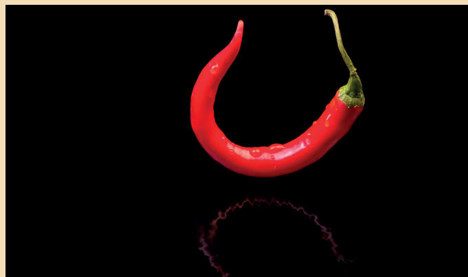
Nach dem Lackieren: Glänzend jedoch uneben.

Reinigung mit W-Tec Clean and Protect S 10.41