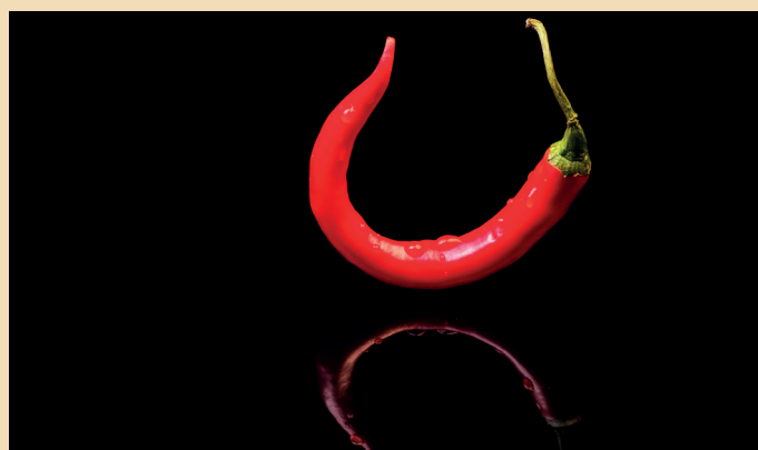
Nach dem Polieren und Reinigen: Hochglanz pur.